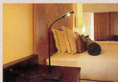
嘉瀬別邸HOTEL & SPA (名護市)